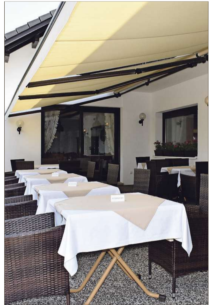
Das Ambiente im Außenbereich des Hotel-Restaurants am Vormberger See ist ansprechend.