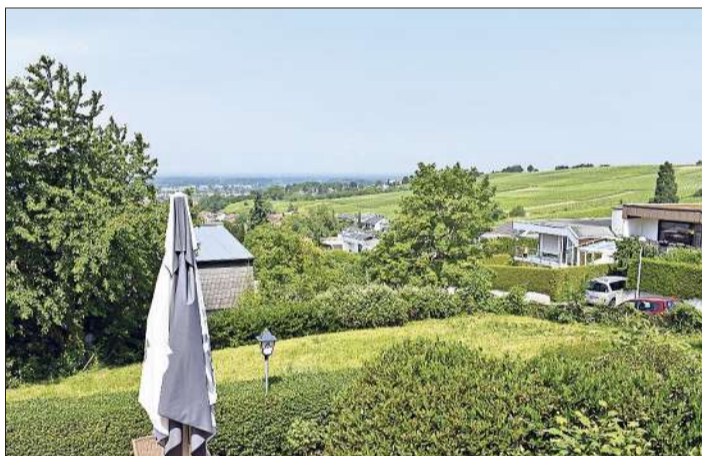
Der Blick vom „Haus am See“ auf die Rheinebene.