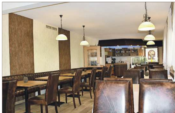
Das Restaurant ist modern eingerichtet und gestaltet.